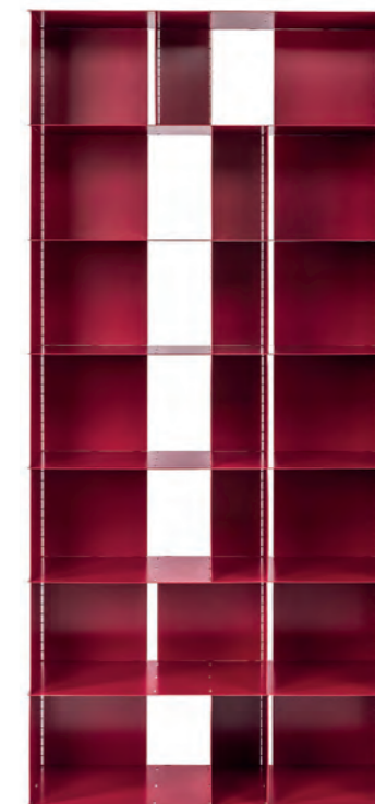
13. Da a Flat, la libreria modulare di Marc Sadler, è un parallelepipedo rettangolare di alluminio totalmente riciclabile e componibile.