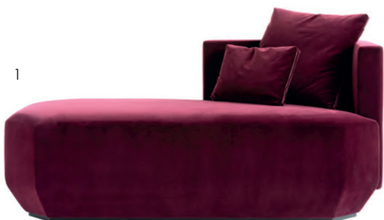
1. Baccarat La Maison Prodotta da Luxury Living Group, la Octogone chaise longue è ispirata nelle forme alla sezione del prisma e nel colore al rubino, tratti caratteristici del brand di cristalleria.

Forme curvy, materiali nobili e colori eleganti per la camera da letto. Dove il mix eclettico tra pezzi classici e nuovi è garanzia di personalità