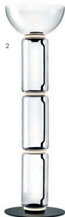
2. Flos Noctambule di Konstantin Grcic è un'eterea scultura di luce composta da moduli cilindrici di vetro che creano modelli da terra e da soffitto, vagamente Déco.