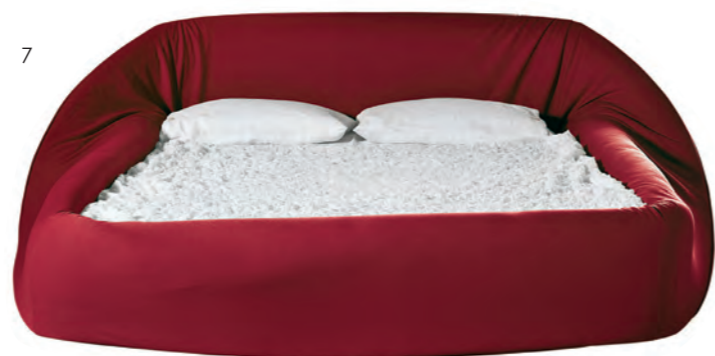
7. Lago Alcova perfetta, il letto Colletto ha un anello di soft foam intorno al materasso, un "colletto" appunto, che può essere arrotolato e srotolato.