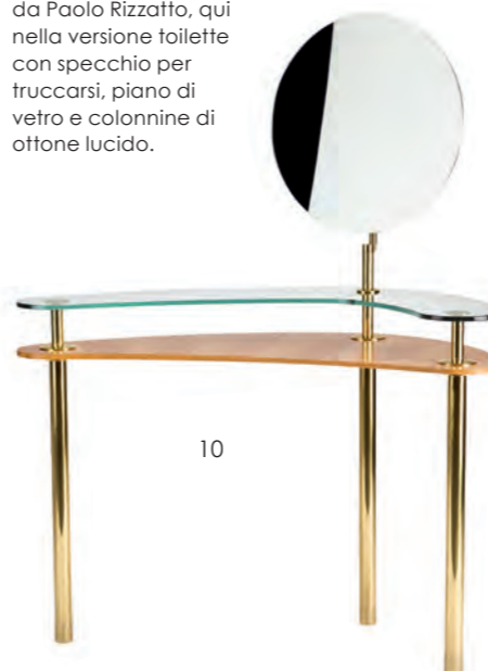
10. Ghidini 1961 Il tavolo Legs, disegnato da Paolo Rizzatto, qui nella versione toilette con specchio per truccarsi, piano di vetro e colonnine di ottone lucido.